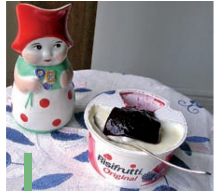
Nykytummojen herkkuhetki: ei riisivelliä, vaan riisifruttia.

– Se, että lähdetään vanhuksen tarpeista, eikä esimerkiksi omaisten tarpeista. Muualta tuleville opiskelijoille kontakti iäkääseen ihmiseen voi taas olla merkittävä asia paikkakunnalle juurtumisen kannal-