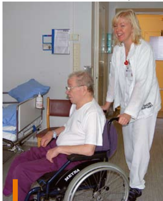
Työvoimapolitiittinen sairaanhoitajakoulutus alkaa Oulussa..