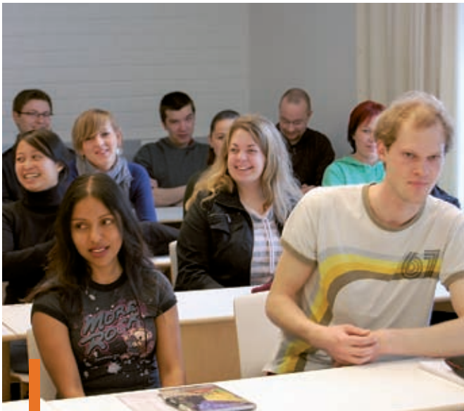
Pieksämäellä harjoiteltiin monikulttuurista kommunikaatiota ja tiimityötä.